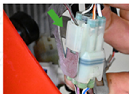
Fanale anteriore/ Front light