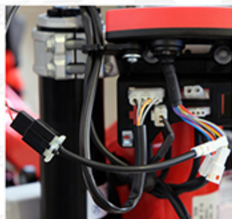
Adattatore contachilometri (facoltativo)/ Odometer adapter (optional)