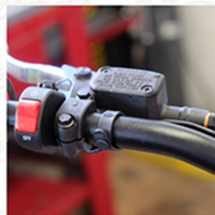
Rimontare interruttore luci/ Fit light switch

Posizionare l'impianto elettrico come in foto qui sotto/ Position the electrical system as in the photo below